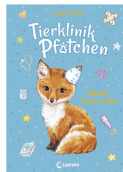
Tierklinik Pfötchen (Band 3) - Kleiner Fuchs in Not