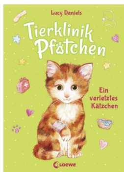
Tierklinik Pfötchen (Band 1) - Ein verletztes Kätzchen