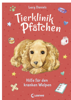
Tierklinik Pfötchen (Band 4) - Hilfe für den kranken Welpen