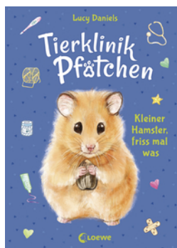
Tierklinik Pfötchen (Band 6) - Kleiner Hamster, friss mal was