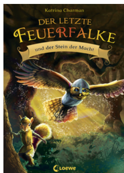
Der letzte Feuerfalke und der Stein der Macht (Band 1)