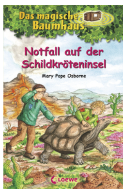
Das magische Baumhaus (Band 62) - Notfall auf der Schildkröteninsel