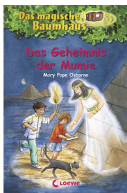
Das magische Baumhaus (Band 3) - Das Geheimnis der Mumie