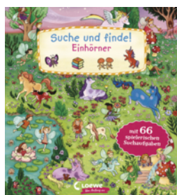
Suche und finde! Einhörner