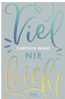
Vielleicht nie (Vielleicht-Trilogie, Band 2)