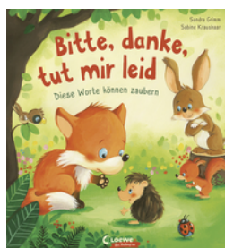
Bitte, danke, tut mir leid