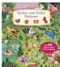
Suche und finde! Einhörner