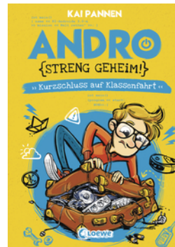
Andro, streng geheim! (Band 3) - Kurzschluss auf Klassenfahrt