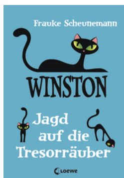
Winston (Band 3) - Jagd auf die Tresorräuber