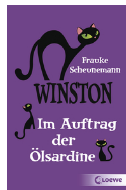
Winston (Band 4) - Im Auftrag der Ölsardine