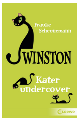
Winston (Band 5) - Kater Undercover