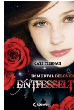
Immortal Beloved (Band 3) – Entfesselt