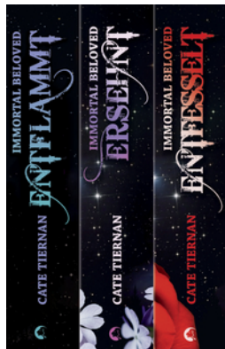
Immortal Beloved – Die komplette Trilogie