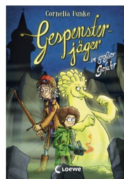
Gespensterjäger in großer Gefahr