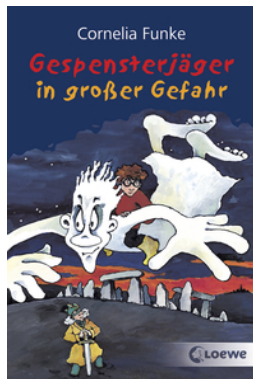
Gespensterjäger in großer Gefahr