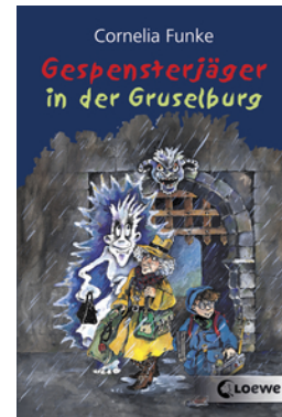
Gespensterjäger in der Gruselburg