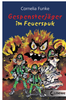
Gespensterjäger im Feuerspuk