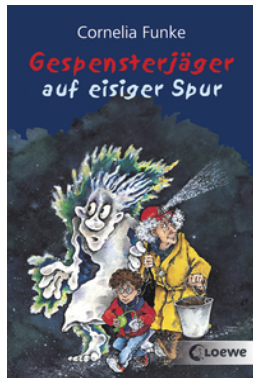
Gespensterjäger auf eisiger Spur