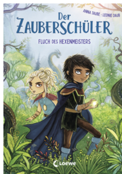
Der Zauberschüler (Band 1) - Fluch des Hexenmeisters