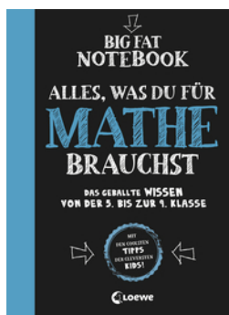
Big Fat Notebook - Alles, was du für Mathe brauchst - Das geballte Wissen von der 5. bis zur 9. Klasse