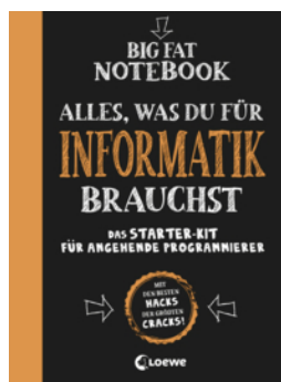
Big Fat Notebook - Alles, was du für Informatik brauchst - Das Starterkit für angehende Programmierer