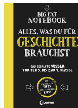
Big Fat Notebook - Alles, was du für Geschichte brauchst