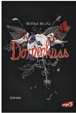
Splitterherz – Dornenkuss