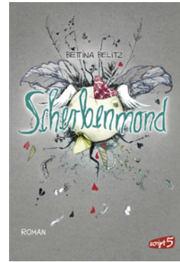
Splitterherz – Scherbenmond