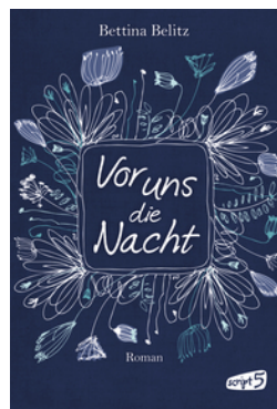
Vor uns die Nacht