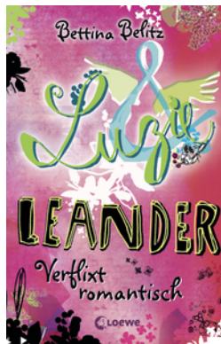
Luzie & Leander - Verflixt romantisch