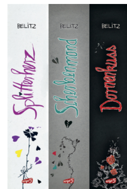
Splitterherz, Scherbenmond, Dornenkuss – Die komplette Trilogie