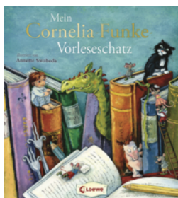
Mein Cornelia-Funke- Vorleseschatz