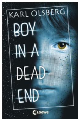
Boy in a Dead End