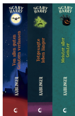
Scary Harry (Band 1-3)