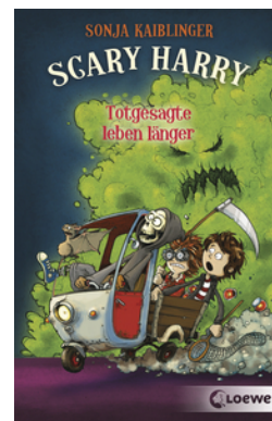
Scary Harry (Band 2) - Totgesagte leben länger