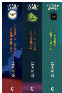
Scary Harry (Band 1-3)