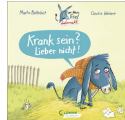
Der kleine Esel Lieber nicht - Krank sein? Lieber nicht!