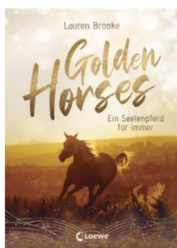
Golden Horses (Band 1) - Ein Seelenpferd für immer