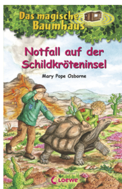
Das magische Baumhaus (Band 62) - Notfall auf der Schildkröteninsel