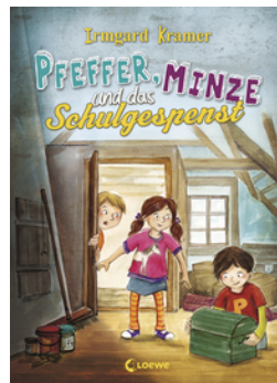
Pfeffer, Minze und das Schulgespenst