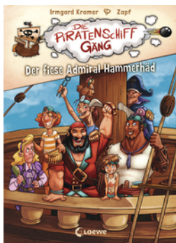
Die Piratenschiffgänger 1 - Der fiese Admiral Hammerhäd