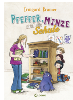
Pfeffer, Minze und die Schule