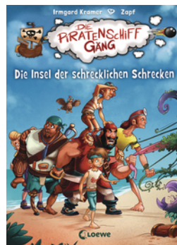
Die Piratenschiffgänger 2 - Die Insel der schrecklichen Schrecken