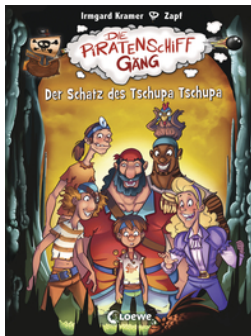
Die Piratenschiffgänger 4 - Der Schatz des Tschupa Tschupa