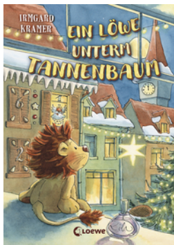
Ein Löwe unterm Tannenbaum