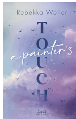
A Painter's Touch (Broken Artists, Band 3)