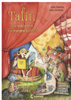
Tafiti - Die schönsten Vorlesegeschichten