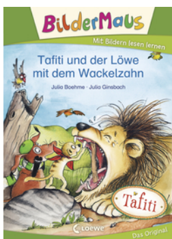
Bildermaus - Tafiti und der Löwe mit dem Wackelzahn