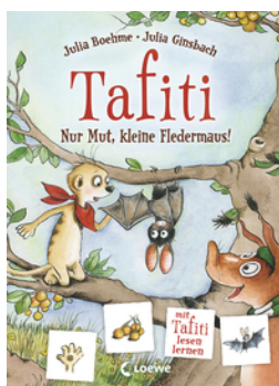
Tafiti - Nur Mut, kleine Fledermaus!