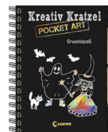
Kreativ-Kratzel Pocket Art: Gruselspaß