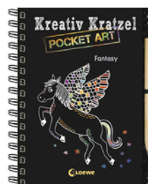
Kreativ-Kratzel Pocket Art: Fantasy