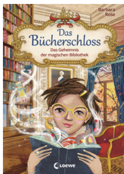
Das Bücherschloss (Band 1) - Das Geheimnis der magischen Bibliothek