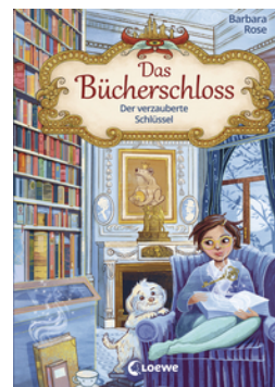
Das Bücherschloss (Band 2) - Der verzauberte Schlüssel