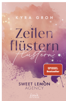
Zeilenflüstern (Sweet Lemon Agency, Band 1)