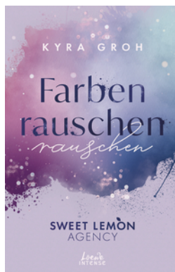
Farbenrauschen (Sweet Lemon Agency, Band 2)