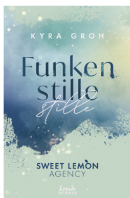
Funkenstille (Sweet Lemon Agency, Band 3)