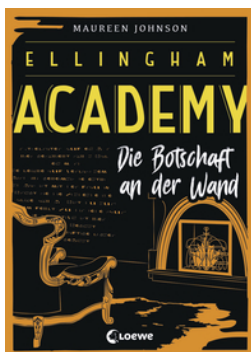
Ellingham Academy (Band 3) - Die Botschaft an der Wand