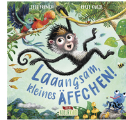
Laaangsam, kleines Äffchen!