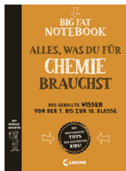
Big Fat Notebook Chemie - Alles, was du für Chemie brauchst - Das geballte Wissen von der 7. bis zur 10. Klasse