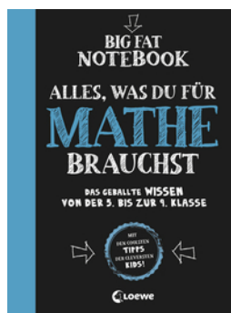
Big Fat Notebook - Alles, was du für Mathe brauchst - Das geballte Wissen von der 5. bis zur 9. Klasse