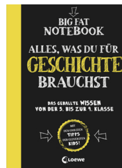
Big Fat Notebook - Alles, was du für Geschichte brauchst