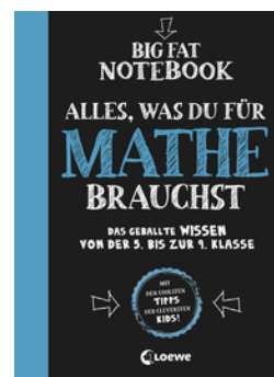
Big Fat Notebook - Alles, was du für Mathe brauchst - Das geballte Wissen von der 5. bis zur 9. Klasse