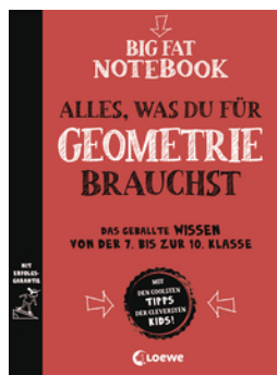
Big Fat Notebook - Alles, was du für Geometrie brauchst