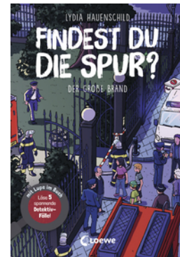
Findest du die Spur? - Der große Brand