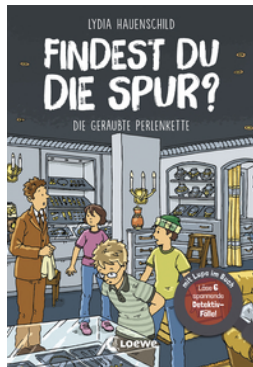
Findest du die Spur? - Die geraubte Perlenkette