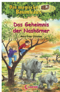
Das magische Baumhaus (Band 61) - Das Geheimnis der Nashörner