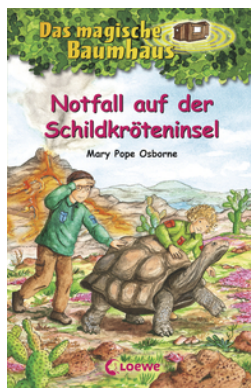
Das magische Baumhaus (Band 62) - Notfall auf der Schildkröteninsel