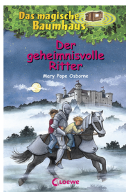
Das magische Baumhaus (Band 2) - Der geheimnisvolle Ritter