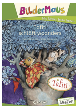
Bildermaus - Tafiti schläft woanders