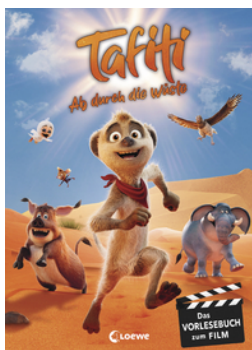
Tafiti - Ab durch die Wüste