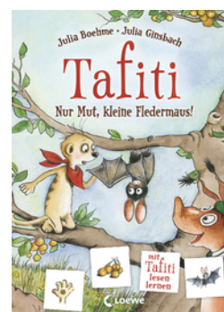
Tafiti - Nur Mut, kleine Fledermaus!