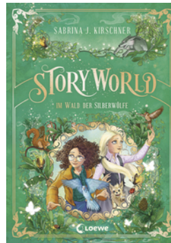
StoryWorld (Band 2) - Im Wald der Silberwölfe