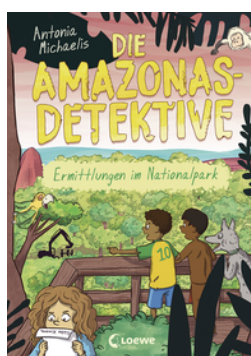
Die Amazonas-Detektive (Band 4) - Ermittlungen im Nationalpark