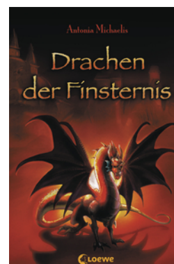
Drachen der Finsternis