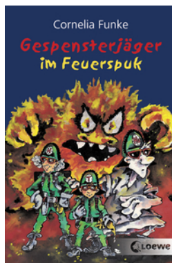
Gespensterjäger im Feuerspuk