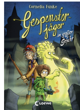
Gespensterjäger in großer Gefahr