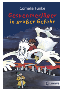
Gespensterjäger in großer Gefahr