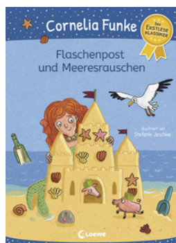
Flaschenpost und Meeresrauschen