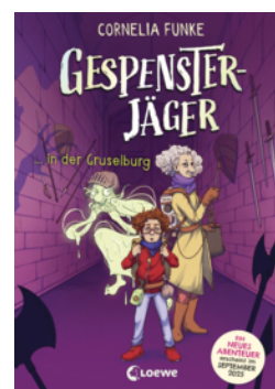
Gespensterjäger in der Gruselburg (Band 3) - Mit 8 neu illustrierten Farbseiten