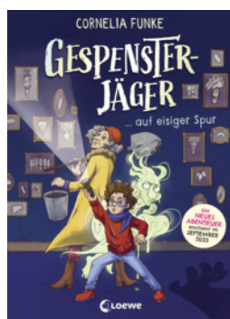
Gespensterjäger auf eisiger Spur (Band 1) - Mit 8 neu illustrierten Farbseiten