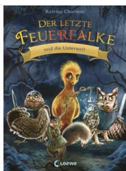
Der letzte Feuerfalke und die Unterwelt (Band 11)