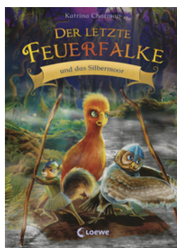
Der letzte Feuerfalke und das Silbermoor (Band 8)