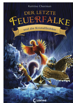
Der letzte Feuerfalke und die Kristallhöhlen (Band 2)