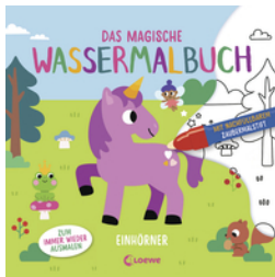
Das magische Wassermalbuch - Einhörner