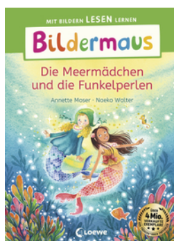
Bildermaus - Die Meermädchen und die Funkelperlen