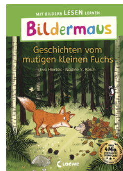
Bildermaus - Geschichten vom mutigen kleinen Fuchs