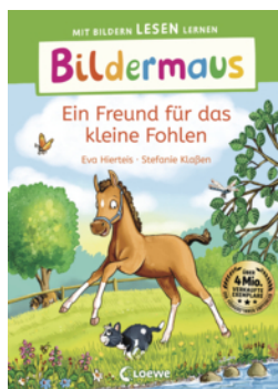
Bildermaus - Ein Freund für das kleine Fohlen