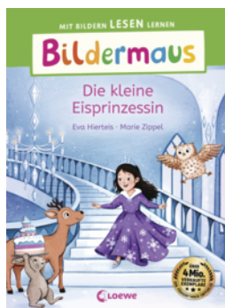
Bildermaus - Die kleine Eisprinzessin