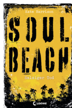
Soul Beach (Band 3) – Salziger Tod