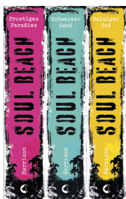
Soul Beach - Die komplette Trilogie