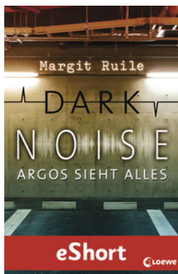
Dark Noise - Argos sieht alles