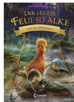
Der letzte Feuerfalke und das Silbermoor (Band 8)