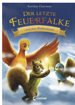
Der letzte Feuerfalke und das Wolkenland (Band 7)