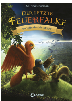
Der letzte Feuerfalke und die dunkle Magie (Band 6)