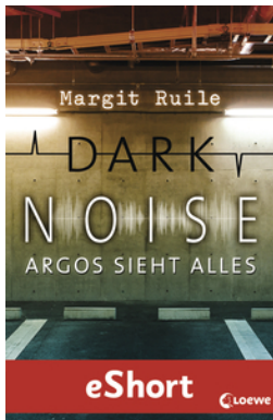
Dark Noise - Argos sieht alles