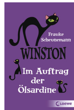
Winston (Band 4) - Im Auftrag der Ölsardine