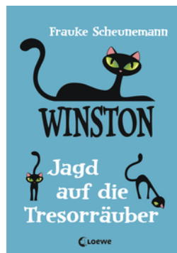
Winston (Band 3) - Jagd auf die Tresorräuber