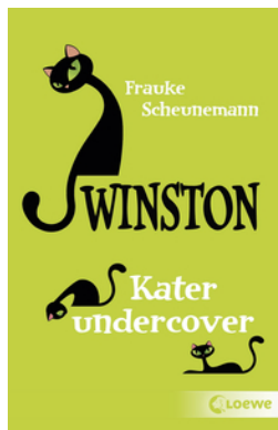
Winston (Band 5) - Kater Undercover