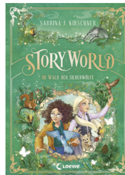
StoryWorld (Band 2) - Im Wald der Silberwölfe