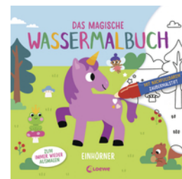
Das magische Wassermalbuch - Einhörner